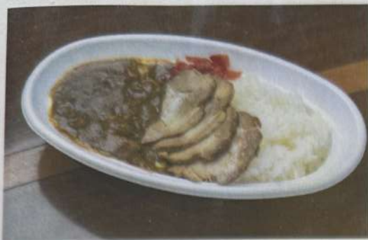
チャーシューカレー 1200円