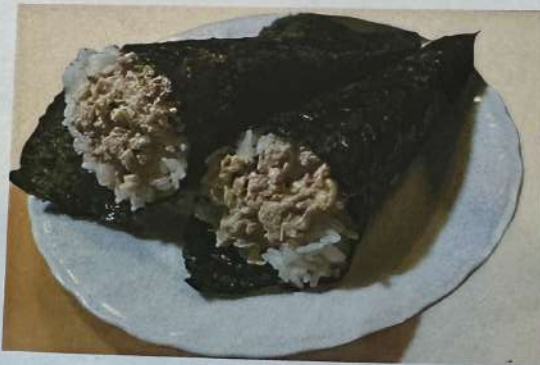
チャーマヨ手巻き 650円