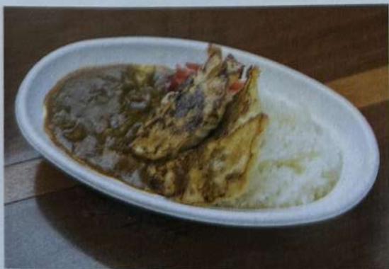
ギョーザカレー 1200円

ライス大盛プラス100円 ご用意にお時間がかかりますので、 店員までお声掛けください。 電話にてご予約も承ります。 受付専用 ☎ 080-8295-7024 (受付時間/10:00~19:00)