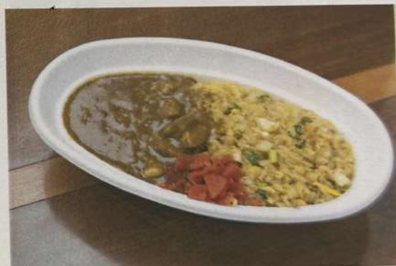
チャーハンカレー 1200円