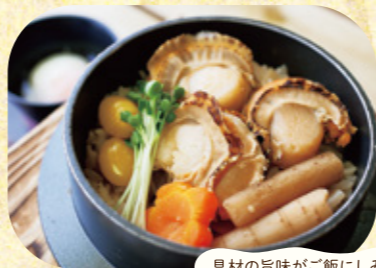
具材の旨味がご飯にしみしみ!

道の駅オープン当初から炊きたての釜飯が評判の食事処。使用する深川産米は釜飯の種類に合わせてブレンドしています。お米の旨みを味わう釜炊き銀しゃりセットもおすすめ。