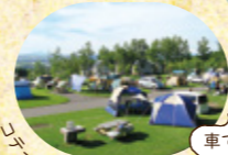
コテージ・ログハウスも人気