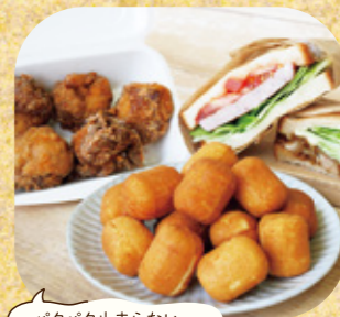
パクパク止まらない〜

ふかがわポークを使ったボリューム満点のサンドウィッチや米粉ザンギが人気。米粉100%で作るベビーカステラは優しい甘さが特徴です。