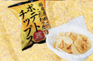
他にもいろんな味があるよ。試してみてね！

100年以上の歴史があるウロコダンゴ、深川産米粉で作るロールケーキ、こめ油で揚げた地元製造のポテトチップスなど、1,000種類以上の品数を誇る深川の土産コーナー。