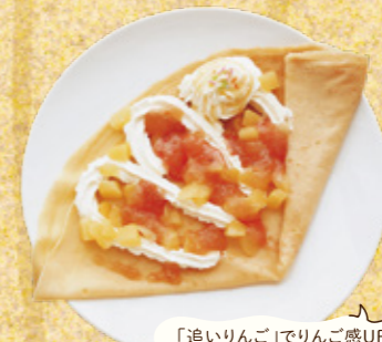
「追りんご」でりんご感UP!

自社農園・藤谷果樹園のフルーツをふんだんに使ったクレープのほか、深川産多度志そばや深川産小麦を使用したうどんも味わえます。