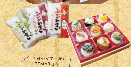
色鮮やかで可愛い「TEMARI」のおむすび♡

朝採れの地元野菜、メロン・りんご・プルーンなどの旬のフルーツ、ふかがわパークの加工品のほか、地元食材で握る月替わりの手まりおむすび、地域限定で生産するお米「ふっくりんこ」も販売しています。