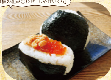
リピート続出! 「わさびいくら」