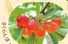
さくらんぼ・プルーン・りんごなど