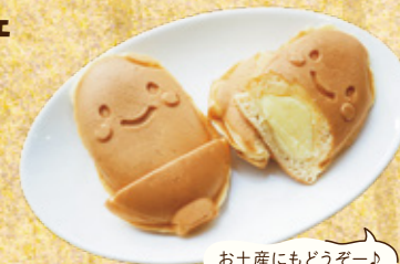
お土産にもどうぞー♪

深川米PRキャラクター「こめっち」をかたどった、人気の焼き菓子。生地には米粉を使い、冷めてもモチモチした食感が楽しめます。