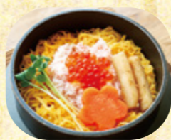
注文を受けてから炊き上げます